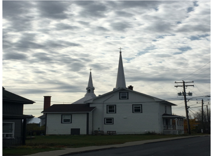
Une vue arrière de l'église

Que ce soit au sujet des saisons ou de l'actualité régionale, certains esprits donnent volontiers dans l'exagération et le négativisme. Heureusement, les arguments ne manquent pas pour faire contrepoids à ces propos. Comme je le disais dans un article précédent au sujet des personnes en perte d'autonomie, il vaut mieux se concentrer sur ce qui reste que sur ce qui est perdu. Ça vaut aussi pour un village.