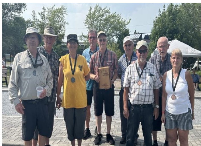
Les trois équipes gagnantes du tournoi

Venez vous aussi jouer avec nous chaque mardi dès 18 h 30 sur le terrain situé aux Habitations de Saint-Bruno. Du plaisir pour tous!