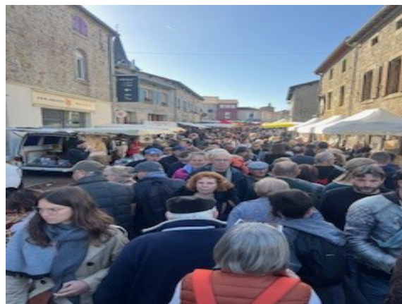
Rue Principale, foire aux champignons